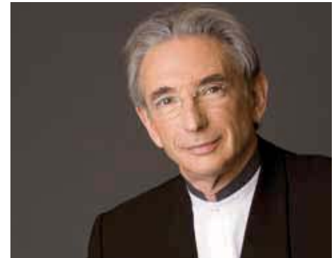
Michael Tilson Thomas (27.05.)