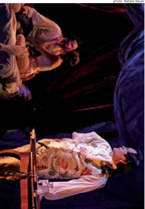
«The Giacomo Variations» – John Malkovich (21. & 22.05.)

si Wolfgang Amadeus Mozart et le librettiste italien Lorenzo da Ponte avaient eux-mêmes consacré un opéra au célèbre séducteur Giacomo Casanova. Naturelle et rondement menée, l'histoire de la vie du séducteur le plus célèbre du 18 e siècle pétille à travers les airs des Nozze de Figaro , de Don Giovanni et de Così fan tutte .» ( Der Standard ).