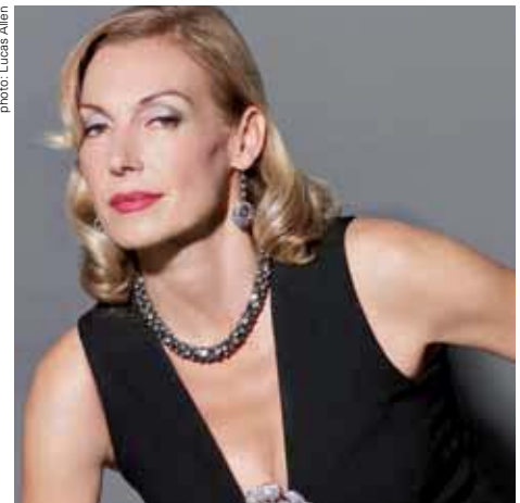
Ute Lemper (06.05.)

10 Quatuor à cordes Mardi / Dienstag 10.05.2011 20:00 SMC Borodin Quartet Nikolai Miaskovski: Quatuor à cordes N° 13 en la mineur (a-moll) op. 86