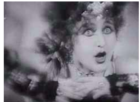
Film: La Nouvelle Babylone (05.05.)

Tickets (dès le 08.04.): 35 / 55 / 75 € (< 27 ans: 21 / 33 / 45 €) – www.philharmonie.lu, (+352) 26 32 26 32