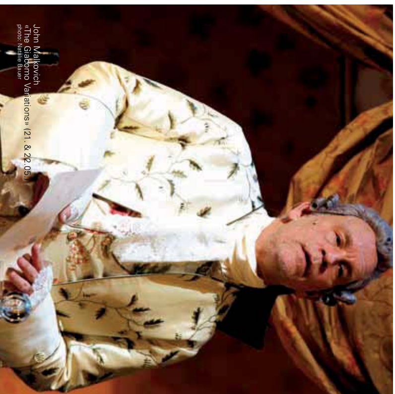
John Malkovich «The Giacomo Variations» (21. & 22.05.)