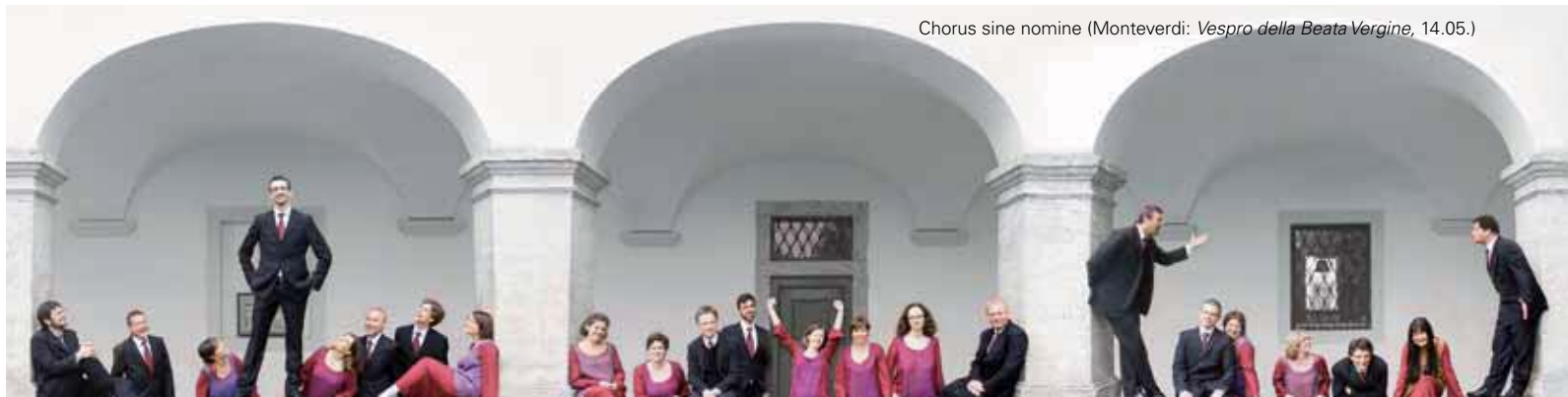
Chorus sine nomine (Monteverdi: Vespro della Beata Vergine , 14.05.)