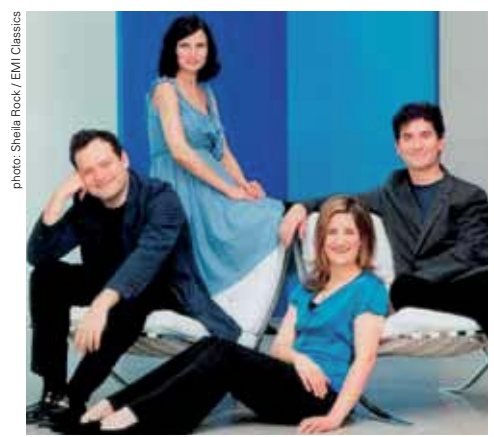
Belcea Quartet (19.05.)