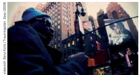
«Long night of the music video» (28.05.)