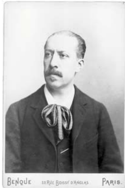
Charles Marie Widor (Photographie Atelier Benque, 1905)

wie seine Kompositionen. Und die Renaissance gerade der französisch symphonischen Orgelmusik und ihre ungebrochene Faszination zeigen überdeutlich, dass die Orgel als (konzertantes) Klangfarbeninstrument durchaus gleichberechtigt neben einem zuweilen antiquiert daherkommenden polyphon-linearen «Organum» zu bestehen vermag.