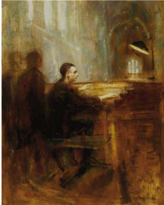
Marcel Dupré à l'orgue de Notre-Dame de Paris (Portrait peint par Ambrose McEvoy, 1920)

les bergers s'approchent de la grotte, les anges donnent leur concert céleste en cette nuit paisible. Le tableau a été mille fois l'objet de soins touchants, tant chez les peintres que chez les musiciens. Et les «pastorales» existent depuis que l'orgue existe: il y suffit d'une flûte et d'un hautbois pour susciter décor et prière. Certes, la fraîcheur d'un Bach ou d'un Franck n'est pas accordée à tous les compositeurs. Mais Jean Langlais proposera en 1932 une Nativité aussi pétrie de grégorien. Et Dupré sait ici mettre de côté son habit empesé de magister ès contrepoint, pour proposer une évocation lumineuse et fragile contrastant heureusement avec les deux violents mouvements qui l'entourent.