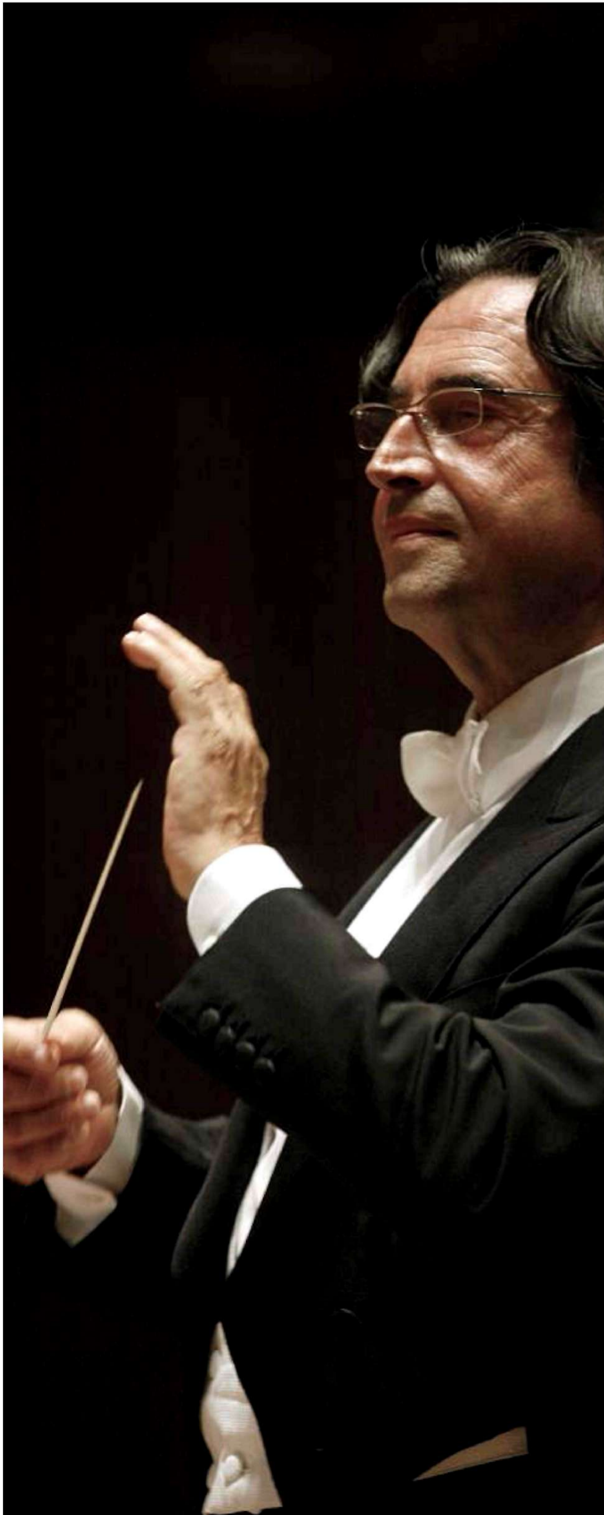
Cette tournée, qui passera deux jours par Luxembourg, débute le 26 août à Salzbourg et se termine le 6 septembre à Vienne. C'est la première tournée européenne de Muti avec le Chicago Symphony Orchestra.

Je lui dirais la même chose que Verdi a dit quand on lui demandait ce qu'il fallait pour devenir un bon musicien : "Trois choses : du travail, du travail et encore du travail." D'ailleurs, je dois dire que je trouve que la direction d'orchestre est devenue une activité basée plus sur le visuel que l'auditif avec une sorte de faux-athlétisme. C'est devenu un art du bouger de bras, alors que ce que mes professeurs, qui venaient de l'école de Toscanini, m'ont appris, c'est que les bras ne sont qu'une extension du cerveau et de l'ouïe. Mais j'ai l'impression que la nouvelle génération n'étudie pas autant la mu-