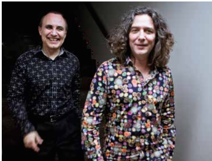
Michel Camilo und Tomatito

Dann aber drückt wieder die komplexe Harmonik des Bebops durch. Und in den lyrischen Momenten offenbart er, dass er seinen Gershwin genau wie seinen Debussy kennt und mit weiten, farbintensiven Spannungsbögen und impressionistischen Tontrauben zu arbeiten vermag.